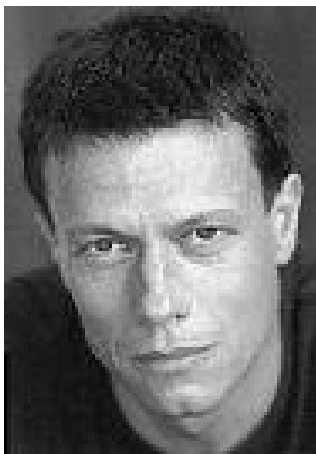
Gavin Hood: el Director

Contra tot pronòstic aquesta pel·lícula sud-africana va guanyar l'Oscar al millor film de parla no anglesa, l'any en que semblaven favorites la palestina Paradise Now, la francesa Joyeux Noël (Feliz Navidad) o l'alemanya Sophie Scholl